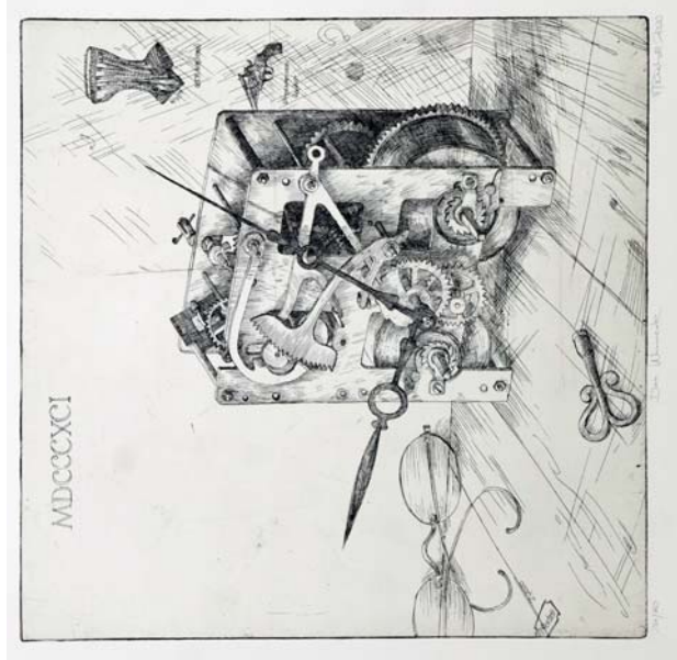
Das Uhrwerk, 2020 Radierung, 30 x 30 cm