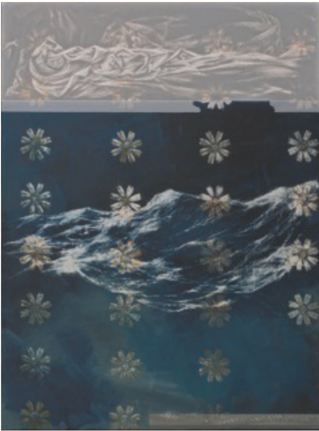
Rán geht baden, Acryl und Schabung auf Tuch, 2022, 120 x 90 cm (Bild oben)

Radierungen & Acryl auf Tuch / Februar - März 2023